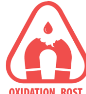
OXIDATION, ROST, KORROSION Oxidation -, Korrosion - und Rostbedingte Auswirkungen

Magnete sind kein Spielzeug! Aufgrund der Kraftereinwirkung können hier schnell Quetschungen entstehen. Ebenfalls können Kleinteile von Kindern verschluckt werden.