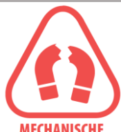
MECHANISCHE BEARBEITUNG Bearbeitungsbedingte Auswirkungen

Neodym – Magnete besitzen einen hohen Metallanteil, was sie zu elektrischen Leitern werden lässt. D.h. Magnete leiten elektrischen Strom. Kinder könnten versuchen, Magnete in eine Steckdose zu stecken und dabei einen gefährlichen Stromschlag erleiden. Auch hier gilt wieder: Magnete sind kein Spielzeug!