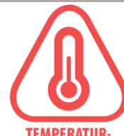
TEMPERATURBESTÄNDIGKEIT Temperaturbedingte Auswirkungen

Einige Magnete besitzen solch starke Anziehungskräfte (bis zu mehreren 100 Kg), dass Vorsicht geboten ist. Achten Sie bitte stets darauf, dass keine Körperregionen zwischen Zwei Magneten liegen, da ansonsten Quetschungen oder sogar Knochenbrüche entstehen können. Tragen Sie aus diesem Grund stets Sicherheitshandschuhe!