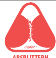
ABSPLITTERN DER BESCHICHTUNG Splitter - Gefahr

Magnete sind bis zu einer Temperatur von 80°C voll einsetzbar (einige wenige auch bis 200°C). Oberhalb dieser Temperatur verlieren sie kontinuierlich, je höher die Temperatur wird, dauerhaft an Kraft.