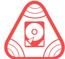
ELEKTROGERÄTE Auswirkung auf Gegenstände

Zum Schutz vor o.g. äußerlichen Einwirkungen, besitzen die meisten Magnete eine dünne Nickel – Kupfer – Nickel – Beschichtung, welche jedoch zerbrechlich und nicht witterungsbeständig genug für den anhaltenden Außeneinsatz ist.