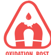
OXIDATION, ROST, KORROSION Oxidation -, Korrosion - und Rostbedingte Auswirkungen

Magnete sind kein Spielzeug! Aufgrund der Kräfteinwirkung können hier schnell Quetschungen entstehen. Ebenfalls können Kleinteile von Kindern verschluckt werden.