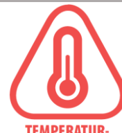
TEMPERATURBESTÄNDIGKEIT Temperaturbedingte Auswirkungen

Einige Magnete besitzen solch starke Anziehungskräfte (bis zu mehreren 100 Kg), dass Vorsicht geboten ist. Achten Sie bitte stets darauf, dass keine Körperregionen zwischen Zwei Magneten liegen, da ansonsten Quetschungen oder sogar Knochenbrüche entstehen können. Tragen Sie aus diesem Grund stets Sicherheitshandschuhe!