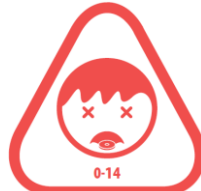
VERSCHLUCKEN Magnete sind kein Spielzeug

Neodym – Magnete dürfen nicht mechanisch bearbeitet werden, da sich hierbei der Bohrstaub leicht entzünden kann. Experten können mittels Diamantwerkzeug, ausreichend Kühlwasser und viel Zeit solche extremen Bearbeitungen vornehmen, jedoch übersteigen meist diese Kosten den eigentlichen Wert des Magneten um ein Vielfaches.