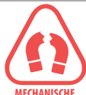
MECHANISCHE BEARBEITUNG Bearbeitungsbedingte Auswirkungen

Neodym – Magnete besitzen einen hohen Metallanteil, was sie zu elektrischen Leitern werden lässt. D.h. Magnete leiten elektrischen Strom. Kinder könnten versuchen, Magnete in eine Steckdose zu stecken und dabei einen gefährlichen Stromschlag erleiden. Auch hier gilt wieder: Magnete sind kein Spielzeug!